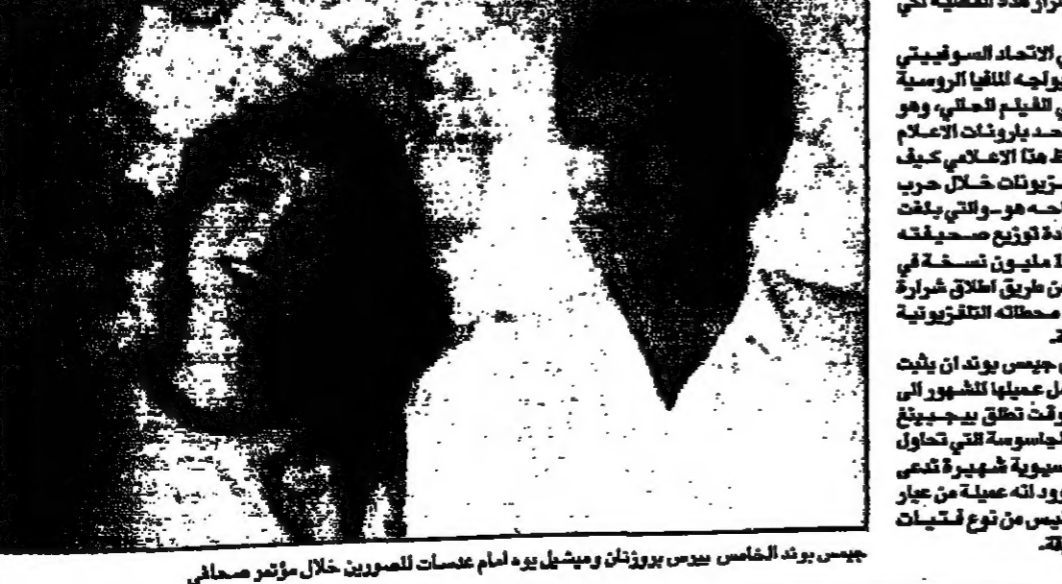
جيمس بوند الفلم الجديد بين بوزناتان وميشيل...